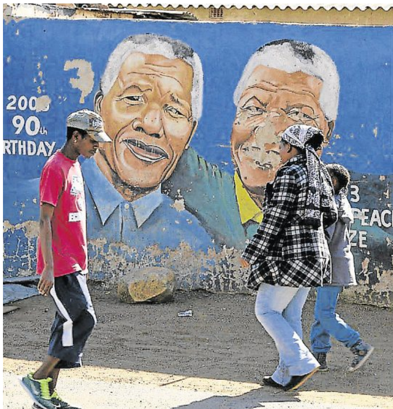
K Sello Duiker a écrit ce roman sur le mal-être de l'Afrique du Sud à 27 ans. Il est mort trois ans plus tard.

Ce livre propose de sillonner la région Poitou-Charentes à la découverte de lieux insolites, bizarres ou mystérieux. On y découvre près de 60 sites sélectionnés pour leur caractère surprenant ou curieux. Bon nombre de ces lieux témoignent d'un paganisme ancestral intense ou de la fantaisie du génie inventif de l'homme.